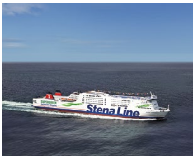
Metanoldrivna Stena Germanica

olika tekniska lösningar för att ta tillvara på vindkraft som komplement till energiförsörjningen ombord samtidigt som flera lovande projekt är på gång. Nackdelar är främst att förutsättningarna är avhängiga av externa faktorer som att det blåser, möjlighet till bropassager m.m.